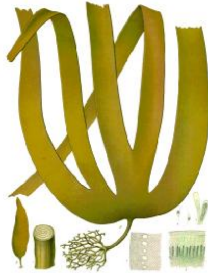
Laminaria cloustoni